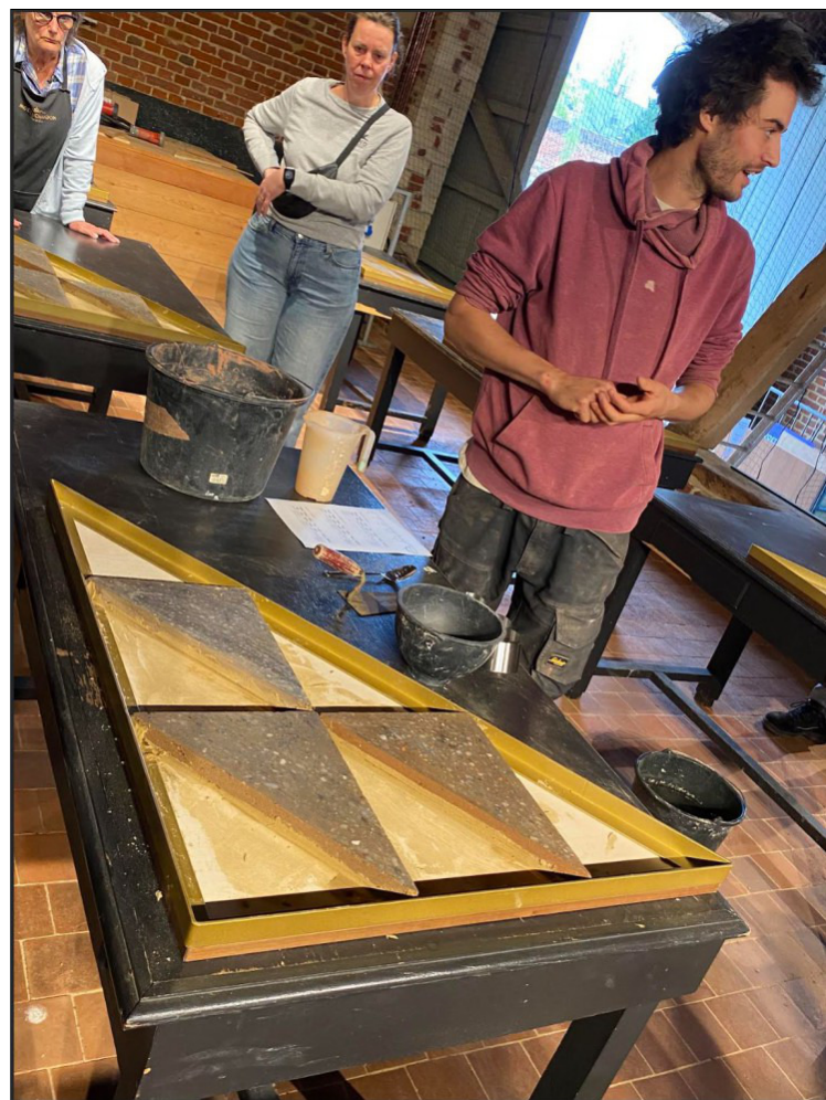
De voorbereidende uitleg

Er is vanalles gaande in Abdij van Park. De restauratie nadert haar einde. Het neerhof verandert langzaam van een modderige werf in een groen plantsoen. De 7 populieren, zinnebeelden van de 7 sacramenten, staan al voor de helling naar het kerkhof. Midden in de binnentuin van het claustrum werd onlangs nog een grote drieledige zilverlinde geplant, symbool voor de drie-eenheid... In de Abdij gebeurt niets zonder betekenis.