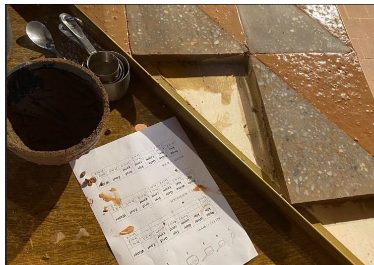
Gekliederd, maar het schiet op