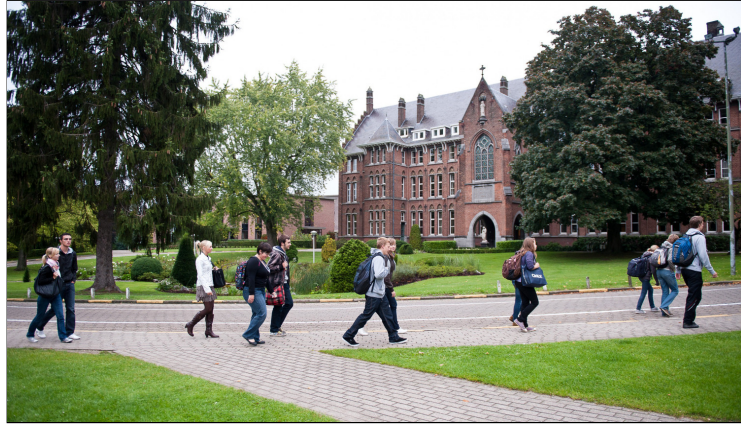
H. Hartinstituut

Waar? Onthaal Heilig Hartinstituut, Naamsesteenweg 355 Heverlee