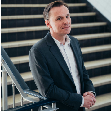
Bruno Vanobbergen - ©CEAH

Op zondag 10 mei viert Cultureel erfgoed annuntiaten Heverlee zijn 40ste verjaardag. Kom mee genieten van dit gevarieerd feestprogramma dat verleden, heden en toekomst op een originele manier verbindt. Jong en minder jong, (oud-)leerlingen, (ere-)personeelsleden, burens, vrienden, kunst- en cultuurminnaars, wandelaars, al wie gepassioneerd is door onderwijs en opvoeding, door leven op een campus en ver daarbuiten, heel erg welkom!