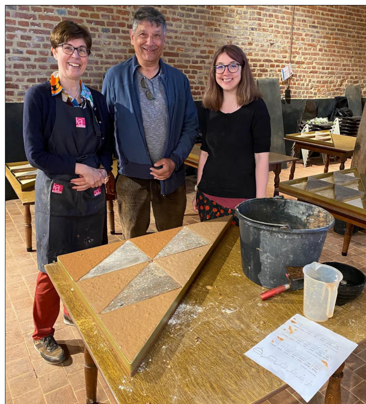
Klaar: tevreden van het resultaat