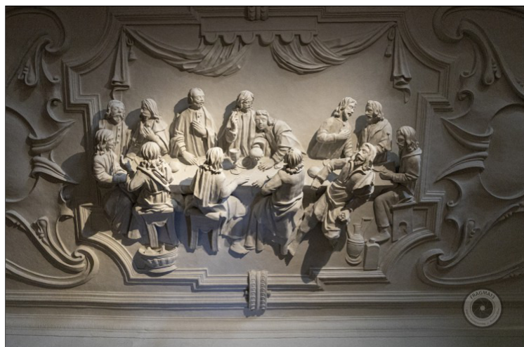
Laatste Avondmaal