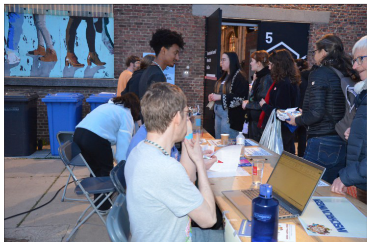
Een warm welkom voor de genodigden.