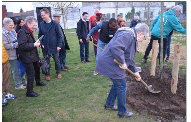
Wie wou, kon een schepje toevoegen. Zo raakte de boom geplant.