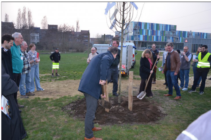
Alle quotes van de meewerkende organisaties hangen in de boom. We kunnen planten.

Heer Jezus, Op vele wijzen sprak jij over dat Rijk, over uw droom. Zo vaak als over een maaltijd, een feestmaal, zelfs een bruiloftsmaal waarop wij allen genodigd zijn. Nodig ons dan ook in deze vastentijd uit aan een grote tafel hier. Dat wij delend met elkaar, nog meer mensen naar uw hart mogen