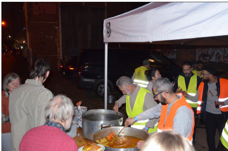
De vrijwilligers van de moskee hadden een eigen keuken ingericht.