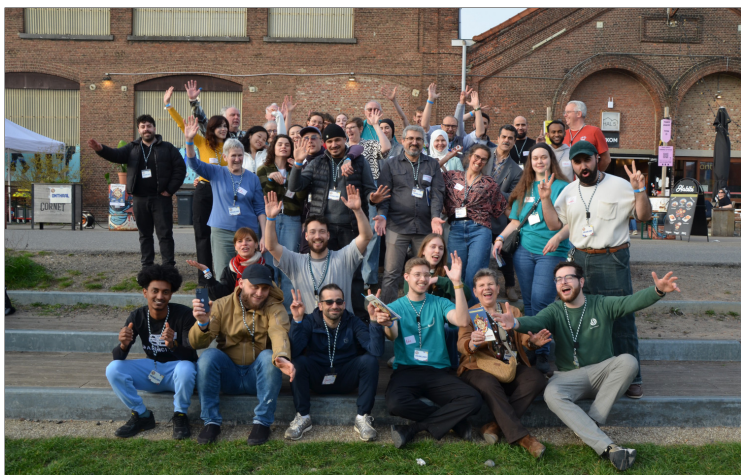
Een bonte bende van vrijwilligers, maar allemaal even enthousiast.