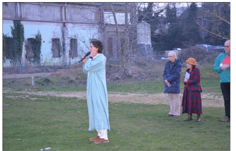
Na een christelijk gebed, de wijsheid van de Baha'i volgt de adhaan, het gebed bij het breken van de vasten bij de moslims.

zelfs de kleinste boom. Dit vragen wij u voor vandaag, voor alle dagen van deze vastentijd, ja zelfs over Pasen heen, tot in uw eeuwig- heid.