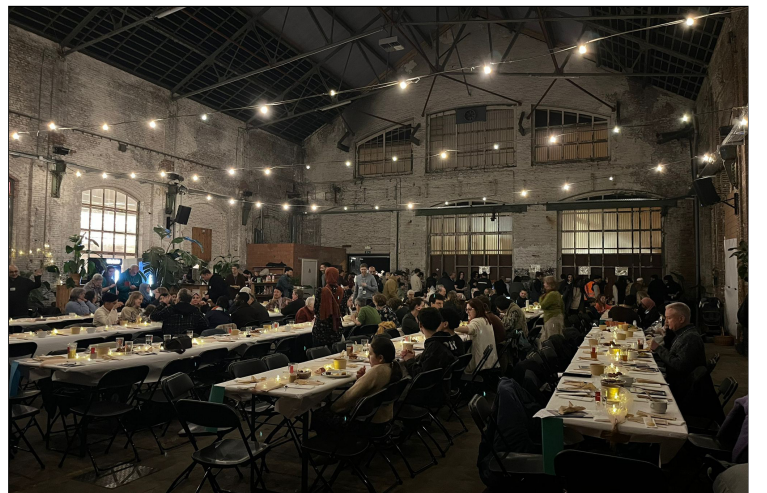
Hal 5 vult zich alsof het bruiloftsfeest gaat aanvangen.

De kleinen, de hongerigen, de dorstigen, de naakten, de gevangenen, de armen. Dat wij ons in hen allemaal ook meer met U mogen verbonden weten. De Ene God, die alles groeien laat,