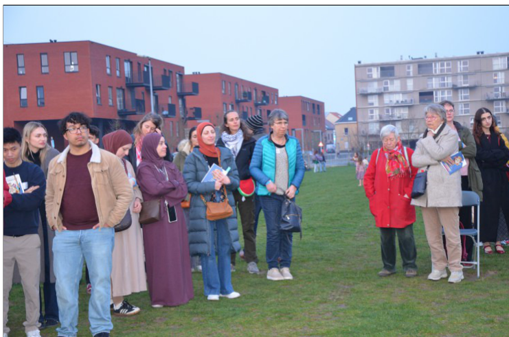
Mensen verstillen op de grasweide bij de start met verschillende gebedsmomenten.