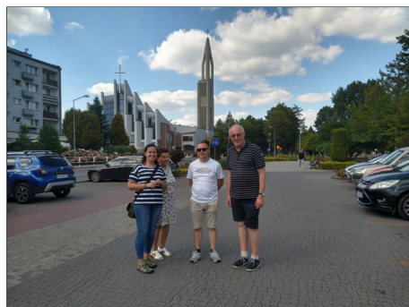
Aan de kerk van Maximiliaan Kolbe