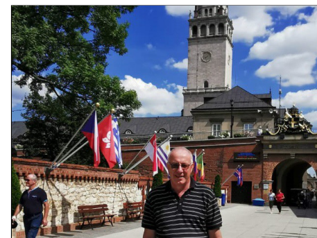
Bij de ingang van het klooster van Jasna Gora