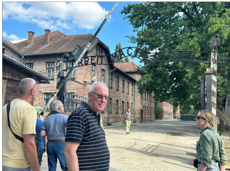
De ingang van Auschwitz