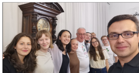
Met de Poolse jongeren van de Wereldjongerendagen