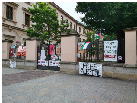
Protest op de universiteit van Krakow