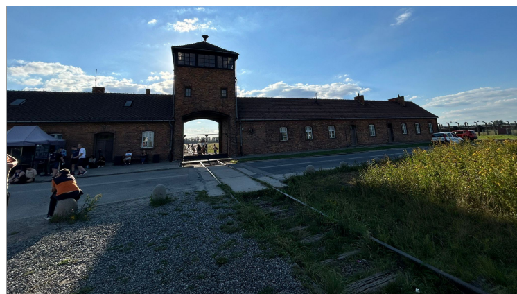
De ingang van Birkenau