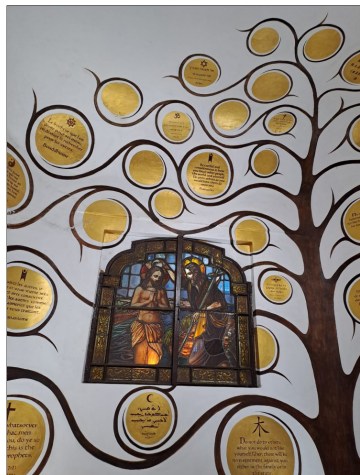
Kapel gulden regel

Deze gulden regel: "Behandel een andere zoals je zelf behandeld wilt worden" wordt kunstig geïllustreerd in de gelijknamige kapel. Een wijsheid die teruggaat naar de diepste bron van alle godsdiensten en levensbe-