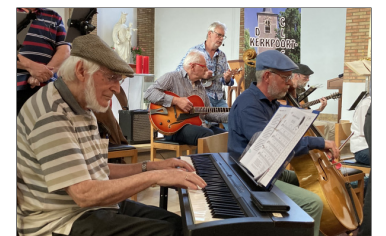
Nu, iets grijzer, pianist bij de Kerkpoortclochards