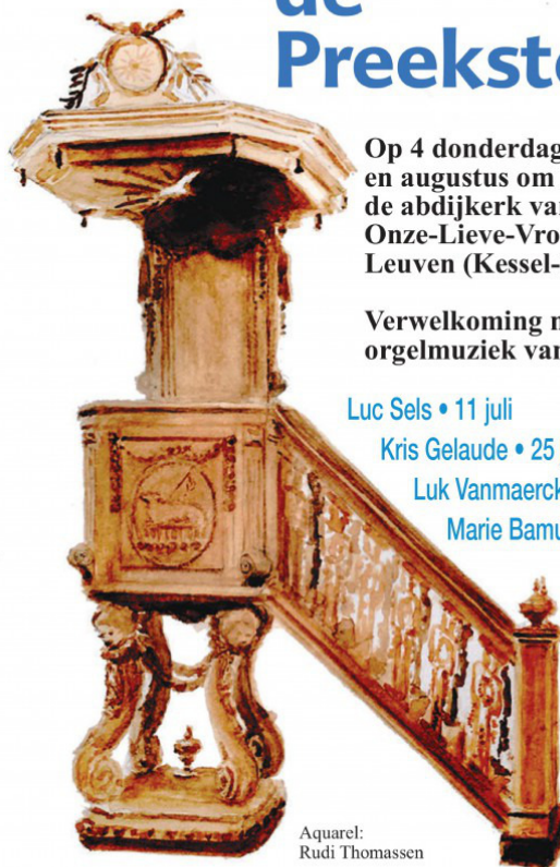
Aquarel: Rudi Thomassen