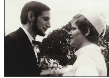
Huwelijk in 1970