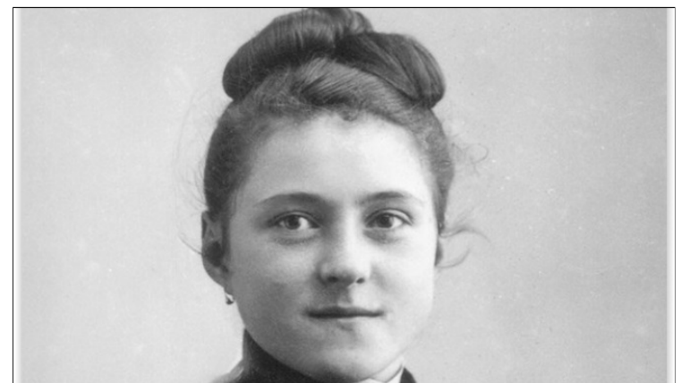
Theresia van Lisieux