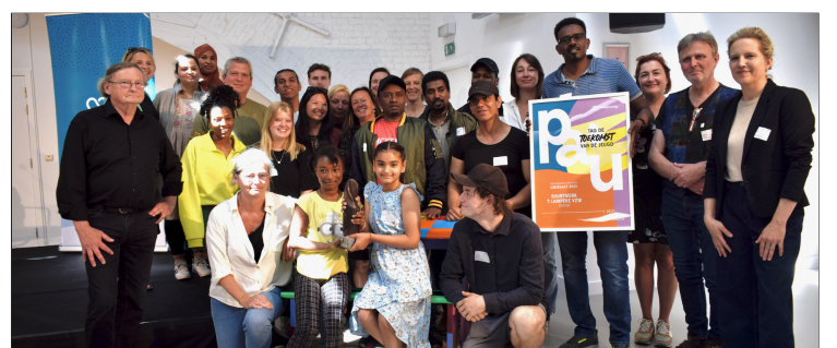
Prijs "Armoede uitsluiten"

Welzijnszorg ondersteunt al vele jaren buurtwerk 't Lampeke in Leuven. Dit buurtwerk levert al vijftig jaar pionierswerk wat betreft de bestrijding van armoede. Dit jaar wonnen ze ook de 24ste prijs 'Armoede uitsluiten' van Welzijnszorg onder meer vanwege hun volgehouden inspanningen naar kinderen en jongeren toe. Meer informatie over 't Lampeke vind je op www.lampeke.be .