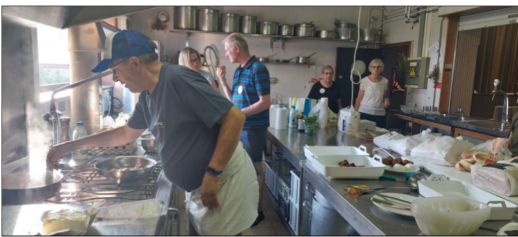
Actie in de keuken

Al vroeg in de ochtend werd de zaal Pakenhof omgetoverd tot een mooie ontbijtruimte met een buffet om "U" tegen te zeggen. In de keuken was het even een race tegen de tijd, maar alles stond perfect klaar om 8u om 43 mantelzorgers te verwelkomen en eens lekker te verwennen met alles wat je bij een ontbijt kan bedenken.