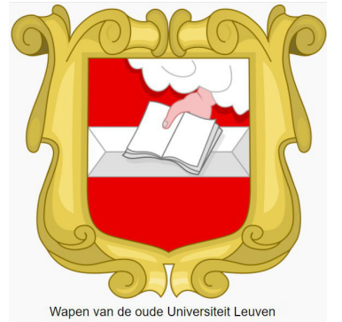
Wapen van de oude Universiteit Leuven

Wij hebben het er eigenlijk niet over gehad, maar de brouwerij had in 't begin van de stichting en start van de Universiteit een Bank functie , 't is te zeggen, elke prof die aan de Unief doseerde kreeg als betaling (vergoeding) maandelijks een aantal liter bier, en had recht op een aantal meter betere, mooiere stoffen voor hun kleding. De proffen die in rangorde konden klimmen, konden na promotie, aanspraak maken op een aantal flessen wijn. Aangevoerd vanuit Frankrijk, was dit reeds een kostelijk grapje. En indien er een prof terug degradeerde, kon het zijn dat hij geen wijn meer kreeg, maar wel nog bier. Vandaar het gezegde "Wijn na bier geeft plezier, bier na wijn is venijn".