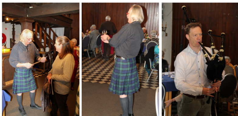
Verwelkoming door een echte Schot

Wij reisden al naar verschillende landen om er lekker te eten: