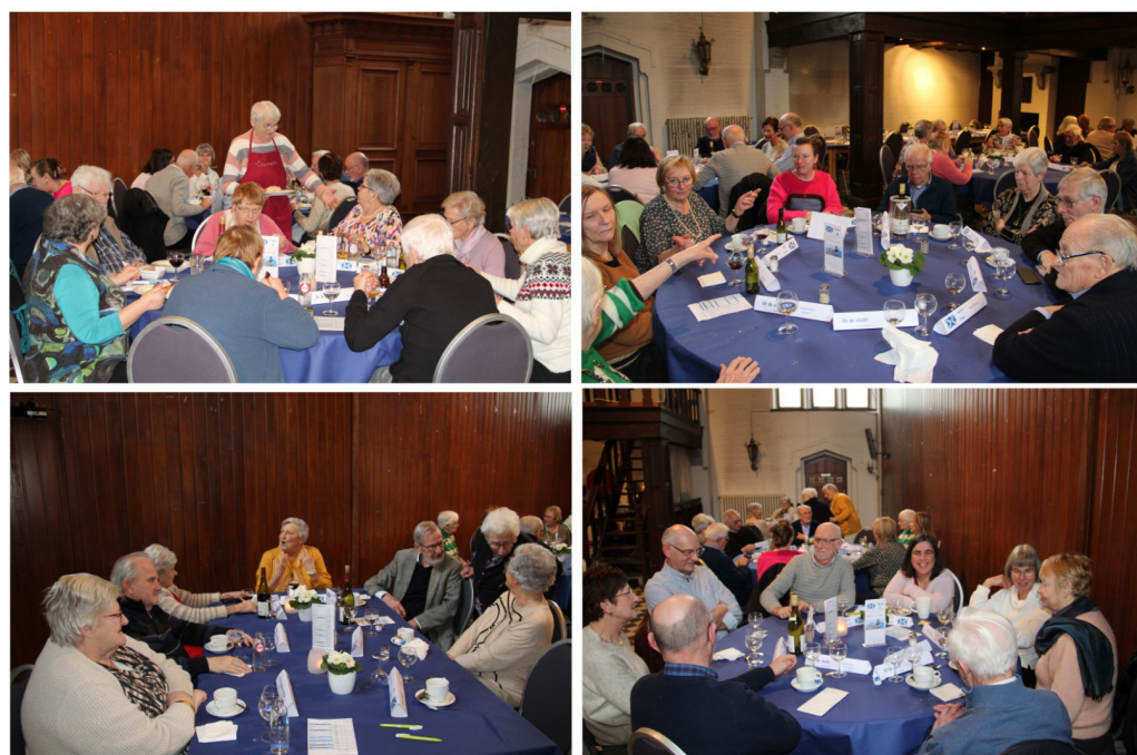
Smakelijk en tot volgend jaar in ??????