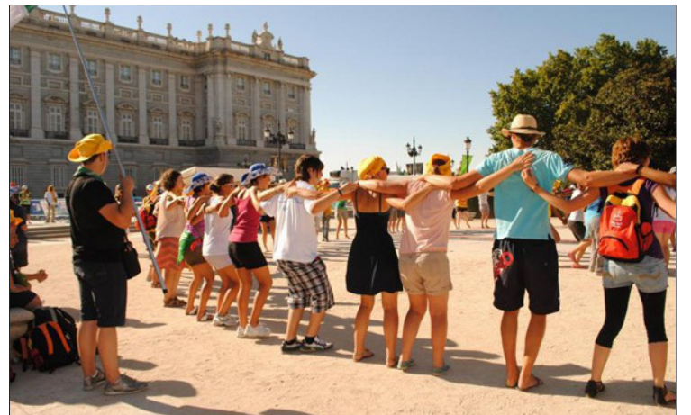
Wereldjongerendagen 2022.

Voor het evenement worden een miljoen jongeren uit de hele wereld verwacht om hun geloof te vieren, de universele kerk te ervaren en een land vol gastvrijheid te ontdekken. Naast gebedsmomenten, ontspanning en gezellig samen zijn zijn er speciale activiteiten