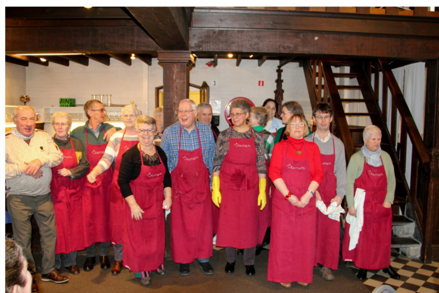
De ploeg van de 'helpende handen'