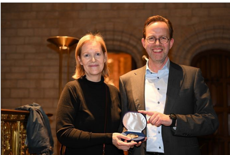
"Inloophuis voor mensen met kanker" won de persprijs, Lifetime Award

De persprijs – ook wel Hugo De Keyserprijs genoemd naar een voormalige collega – gaat elk jaar