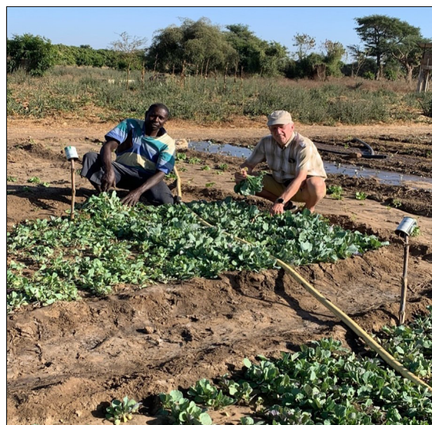
Tijdens ons verblijf werden er ook nog verschillende stroken kolen bijgeplant, kolen zijn blijkbaar erg in trek en leveren een goede prijs op