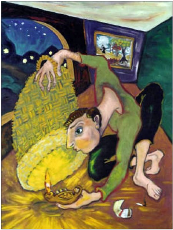
De lamp onder de korenmaat - C. Dare

Uit de Don-Boscoviering van zo 5/2/2023 - 5de zondag door het jaar