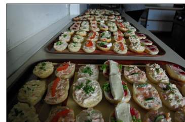
...en de heerlijke hapjes en drankjes, klaargemaakt door OKRA