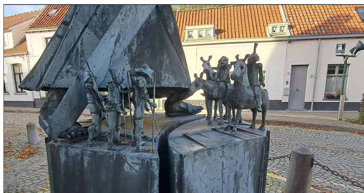
Lissewege - Standbeeld van Willem van Saefringhe - detail