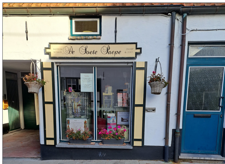
Lissewege - De Soete Paep

Damme heeft een andere aantrekkingspool. Bij het bredere publiek is Damme vooral bekend als boekenstad en voor zijn stadhuis. Na een lange omweg zijn we met nagenoeg een uur vertraging aangekomen in de brasserie "De Spiegel". Voor een grondiger bezoek aan dit oer-Vlaams stadje bleef geen tijd over. Een boottocht bracht ons van Damme naar Brugge. De kaarsrechte Damse vaart is afgezoomd met hoog opgeschoten riet en omzoomd door ranke populieren rijen die ondanks de noordenwind hun status behouden. Een verjonging van deze populieren valt te overwegen. Momenteel is de vaart eerder