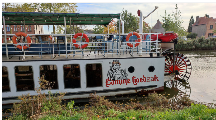
Een boottocht bracht ons van Damme naar Brugge