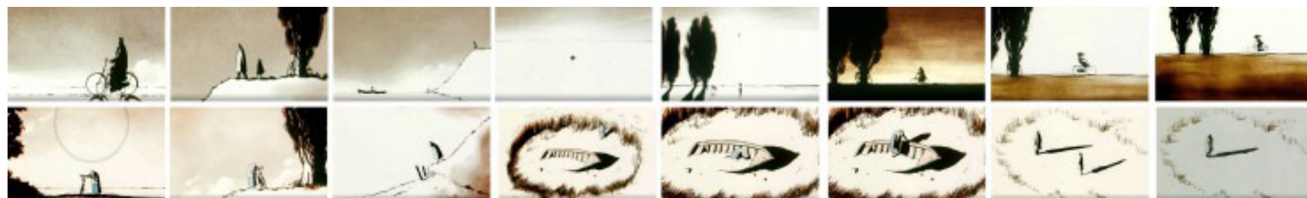
Vader en dochter - Michael Dudok de Wit - kortfilm - enkele fragmenten

Is moeizaam de draden losmaken uit het spinrag der belevenissen loskomen achterlaten niet kunnen vergeten.