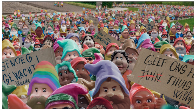
Campagne 17 oktober: Werelddag van het Verzet tegen Armoede

Don Bosco Zondag 16 oktober 2022 – werelddag van verzet tegen armoede