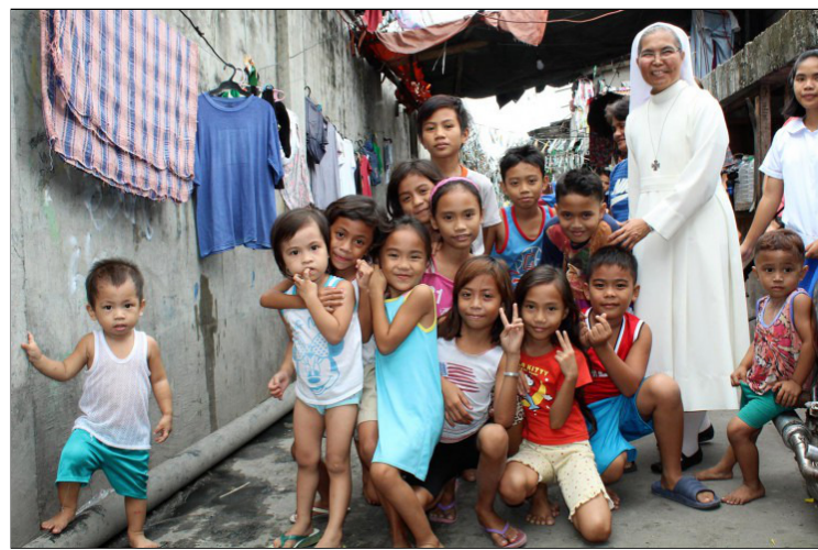
Philippines-slums - De Zusters bij hun recruiteringsmissie in de sloppenwijken.

Wat moet een kind op school zonder lesmateriaal?