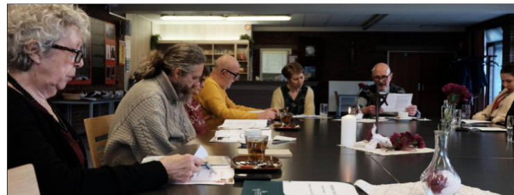
Pastorale vrijwilligers 'Zinzorg thuis' komen voor de eerste keer samen

Nabije en spirituele zorg in je vertrouwde omgeving