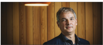
Koen Pelleriaux

Mia Doornaert (is onafhankelijk expert in internationale betrekkingen. Haar column verschijnt tweewekelijks in De Standaard op donderdag):