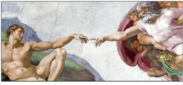
De schepping van Adam is een onderdeel van het fresco op het gewelf van de Sixtijnse Kapel in Vaticaanstad geschilderd door Michelangelo rond 1511.