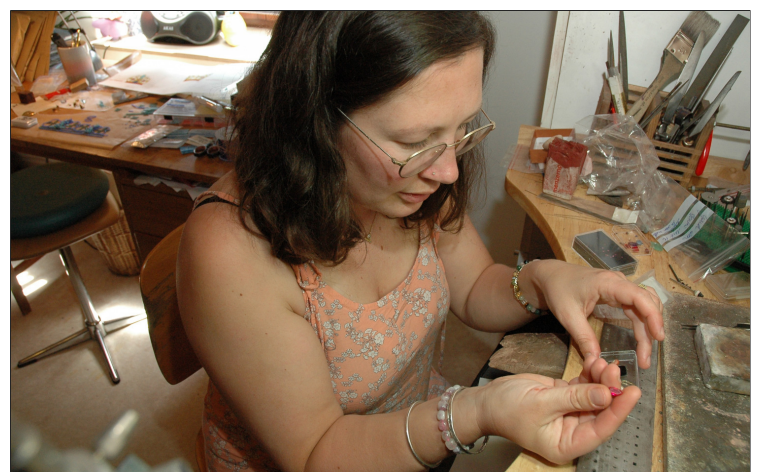
Lies aan het werk in haar atelier

Hoe gaat het dan verder? 'Ik maak alles eerst in was. Daarbij gebruik ik een aantal motieven uit de originele juwelen om een indruk in de was te prenten. Op die manier zijn de oorspronkelijke sieraden eveneens nog aanwezig. Dat wassen model wordt