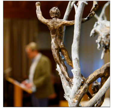
Een detail van het kunstwerk

De arts stuurde me op pad. Een man had vandaag te horen gekregen dat hij kanker had. Veel te jong om aan de mogelijkheid van eindigheid te denken. Ik ontmoette een ietwat stoerdere kerel, die mij meteen hartelijk welkom heette als pastor. Hij toonde vrij vlug zijn bovenarm met een grote tatoeage van een kruis. Hij vertelde dat dit voor hem erg heilig was. Hij was groot geworden bij zijn grootouders. Zijn grootmoeder was een ontzettend lieve vrouw voor hem geweest. Haar leven werd getekend door twee dingen, of was het maar één. Het kruis staande voor haar geloof dat grond