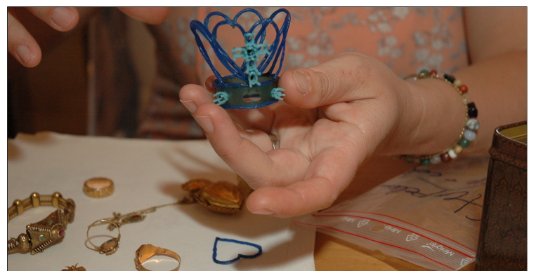
Het kroontje in was