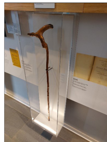
Stok van Damiaan

Het was een leerrijk museumbezoek, afgesloten met een gezellig sa-