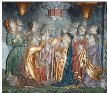
Tafereel Hemelvaart uit altaarstuk in de kapel van Notre Dame de la Housaye van het Bretonse Pontivy - Frankrijk

Gezegend die staat aan het begin en aan het einde van ons bestaan. Maar die ook met ons op weg gaat, als Vader, Zoon en heilige Geest. (Kris Ge-laude)