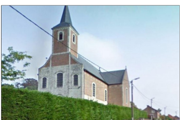
Sint Remigiuskerk Neervelp

Voor onze jaarlijkse zomerzoektocht trekken we dit jaar naar Boutersem (Neervelp)