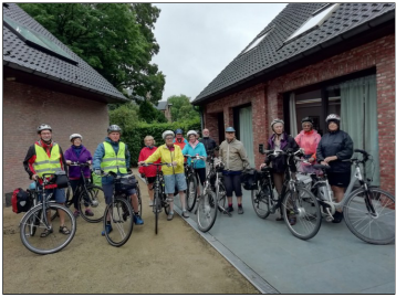
Fietsen met Seniorama