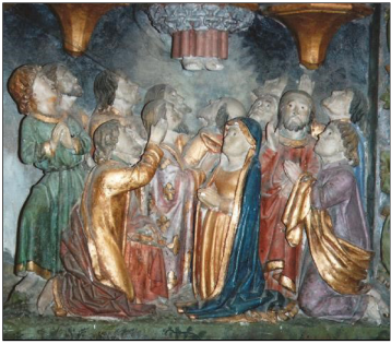
Tafereel Hemelvaart uit altaarstuk in de kapel van Notre Dame de la Housaye van het Bretonse Pontivy - Frankrijk

Gezegend die staat aan het begin en aan het einde van ons bestaan. Maar die ook met ons op weg gaat, als Vader, Zoon en heilige Geest. (Kris Ge-laude)