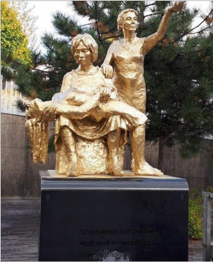
De onbekende doortocht Vrede heeft vrouwen nodig Laten en in november