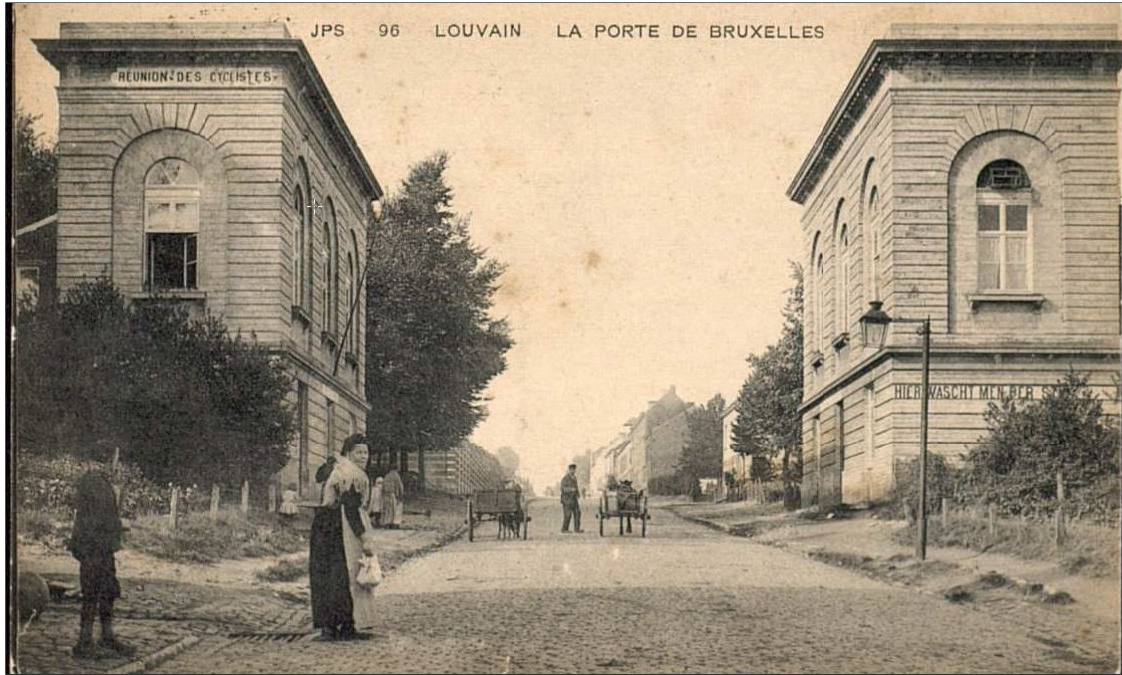
Tolhuizen in Leuven

De twee tolhuizen aan de Brussels-poort zijn de laatste tolhuizen van Leuven.