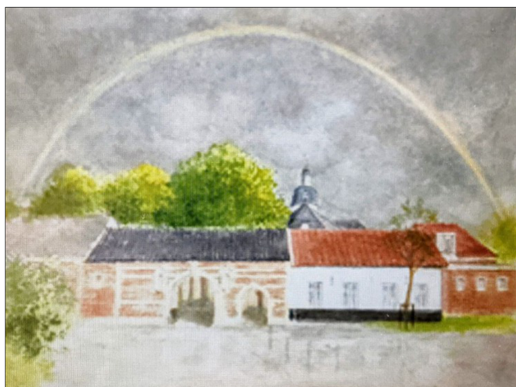
Kleurrijke aquarel van Rudi Thomassen

Een regenboog spande zich over de Abdij van Vlierbeek. Het was de kleurrijke aquarel van Rudi Thomassen op het volboekje bij het voorbije bezinningsmoment in Vlierbeek op zondag 3 april. Een heel treffende en goed gekozen illustratie. De bijbel verhaalt hoe God na de zondvloed een regenboog in de hemel plaats om zijn Verbond met de mens en de hele schepping te bevestigen. 'Nieuw verbonden' was dan ook het thema van deze vastenbezinning. De vasten is een periode dat wij ons leven weer herijken op het Verbond dat God met ons sloot. Het Vicariaat Vlaams-Brabant/Mechelen en de pastorale zone Kesselinde organiseerden deze in onze pastorale regio Leuven geïnspireerd door de aandacht van paus Franciscus voor integrale ecologie.