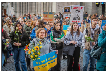
Pakkend solidariteitsmoment in Leuven

Honderden Leuvenaars hebben zich donderdagavond 3 maart op de Grote Markt in Leuven verzameld om hun afkeer voor de oorlog in Oekraïne te tonen.