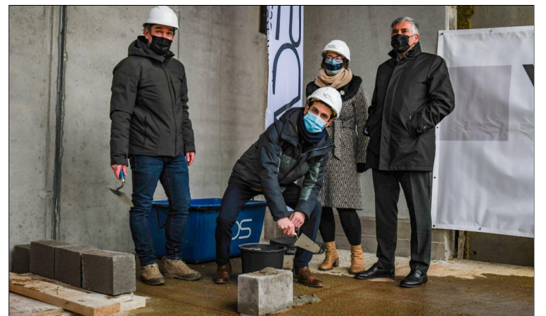
Leuven Artoisplein – sociale appartementen © Krant Het Nieuwsblad – 27 januari 2022

Leuven - Nieuwe sociale appartementen moeten soelaas brengen voor ellenlange wachtlijsten.