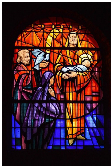
Opdracht van Jezus in de tempel