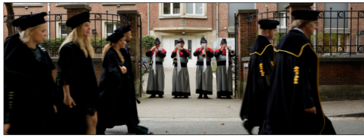
KU Leuven Eredoctores

U zet zich mee in voor onderzoek en projecten die u nauw aan het hart liggen. U wil vooruitgang en investeert daarom mee in een betere gezondheidszorg, in kwaliteitsvol en toegankelijk onderwijs of in erfgoed en cultuur.