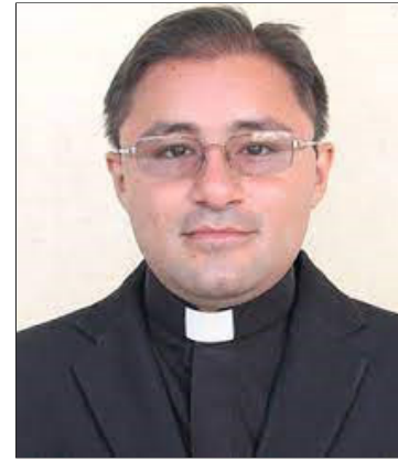
Pater John Miller Garnica Abril