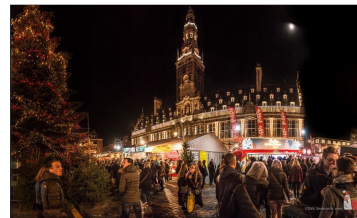
Leuvense Kerstmarkt gaat niet door

De organisatoren van de Leuvense Kerstmarkt hebben beslist om de editie van eind dit jaar te annuleren. Reden is uiteraard de vierde coronagolf en het staat in de sterren geschreven dat er nog grote events zullen volgen.