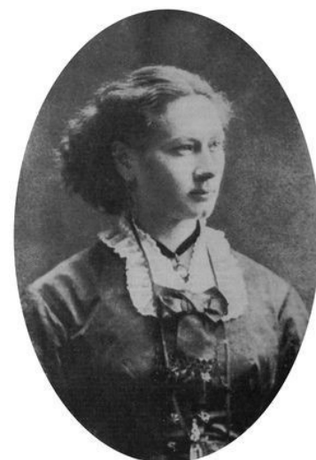
Dokteres Isala Van Diest

De Leuvense Isala Van Diest was de eerste vrouwelijke arts van België. 137 jaar geleden gaf een Koninklijk besluit haar de toestemming haar beroep uit te oefenen.