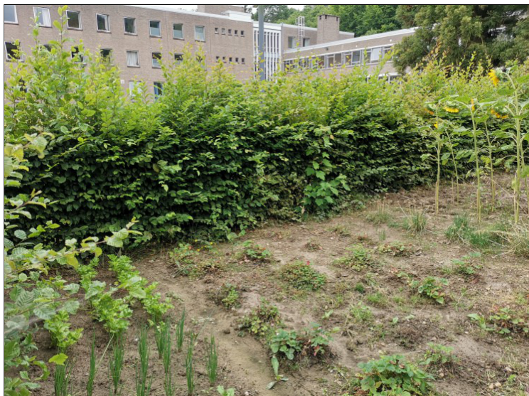
Volkstuinen Salvenbos Heverlee

Leuven – Bewoners die graag tuinieren maar geen of slechts een kleine tuin hebben, kunnen vanaf volgend voorjaar een volkstuintje huren van de stad.