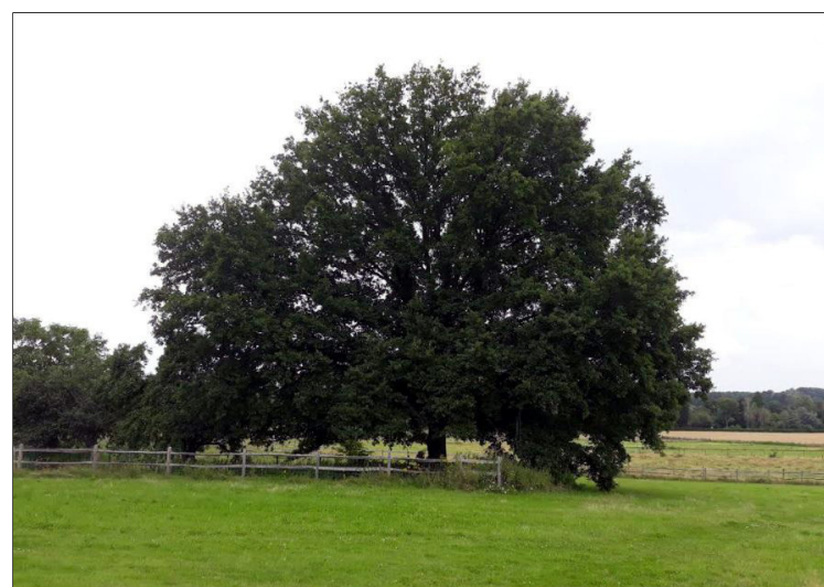
Boom in de vlakte rond "de Torenvalk" in Oud-Heverlee