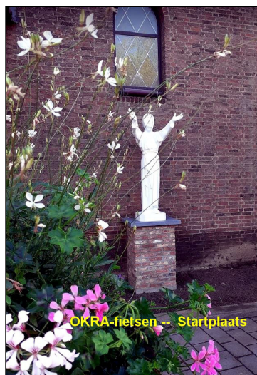
OKRA-fiezen -- Startplaats

Zoals gewoonlijk verzamelden we aan de parochiezaal.