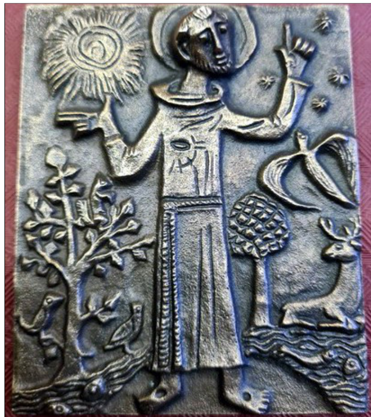
"Om je te blijven inspireren willen we je een geschenk aanbieden"