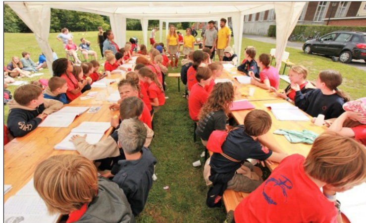
Tijdens de 'laatste kampdag' bootste de Chiro de hoogtepunten van een normaal kamp na.

Jeugdbeweging moest kort na aankomst in Saint-Aubin Philippeville het kamp alweer opbreken door stortregen.