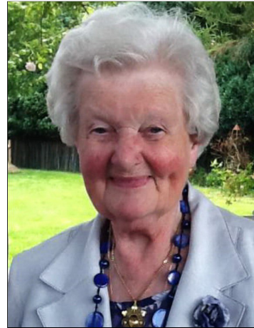
'Veel familie', zei ze met haar zachte warme stem. We zullen je nooit vergeten.

Ik heb gelukkig geleefd niets gevraagd en veel gekregen en ben van alle dingen voldaan stilletjes ter Here gegaan. Stijn Streuvels