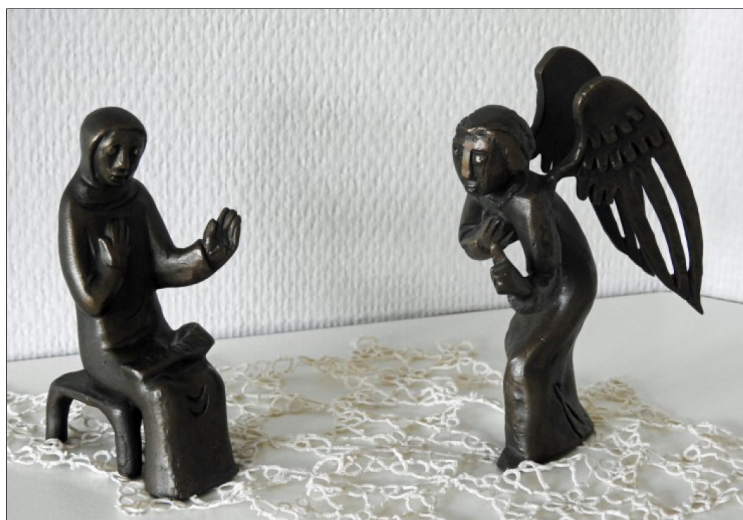
Een engel brengt Maria goed nieuws (Weinert)