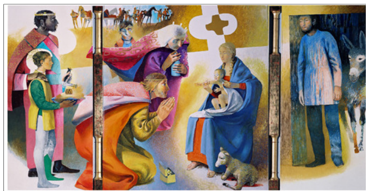
Schilderij van Arcabas – De aanbidding van de wijzen uit het Oosten (2001)

We hebben Kerstmis, Oudejaan en Nieuwjaar moeten vieren in ons eigen gezin, met onze bubbel, met on(ze)s knuffelcontact(en) of zelfs alleen, maar hopelijk niet zonder verbondenheid met andere familieleden en vrienden, via kaartjes, berichtjes en app'jes. Misschien heb je ook nog andere mogelijkheden ontdekt om anderen op een veilige manier te ontmoeten.