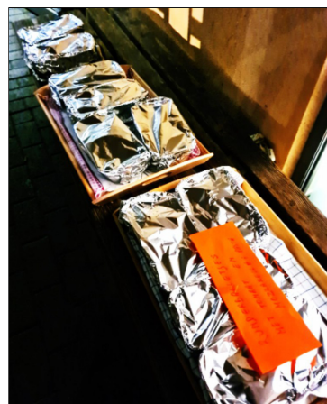
Warme maaltijd bij aflevering

maal. Zou het kunnen dat sommigen onder ons door gezondheidsproblemen, werkloosheid, relatieproblemen, enz. ooit zelf een zwakke schakel waren in één van de kettingen die onze samenleving rijk is?