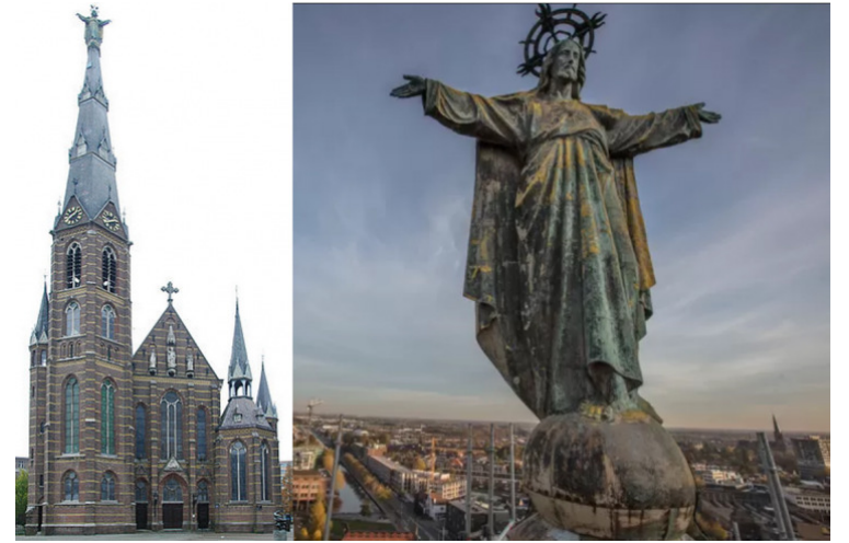
Toren H. Hartkerk in Eindhoven.

Ook een kerk die geen kerk meer is, kan je helpen om meer christen te worden.