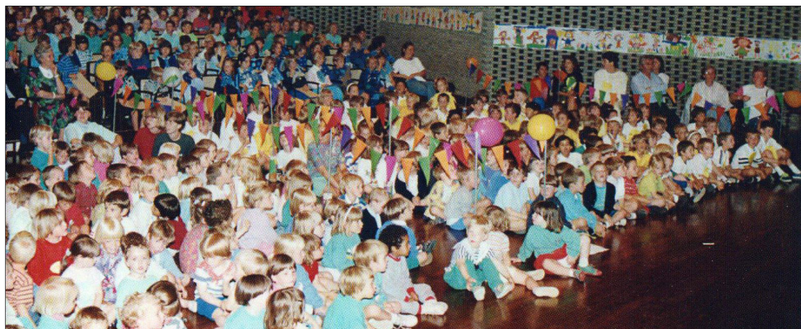
Het cultureel centrum van Bierbeek was afgehuurd

Een heel klein lichtje dat staat voor een teken van leven zodat je nooit meer zal vergeten dat zelfs met dat kleine lichtje er heel veel liefde is te geven.