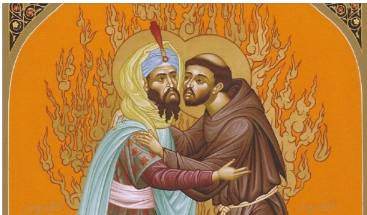
icoon die de ontmoeting van Franciscus met sultan Malik Al-Kamil weergeeft

In het jaar 1219 in volle kruistocht trok de heilige Franciscus ongewapend naar de aanvoerder van het vijandige leger, sultan Malik al-Kamil . Beiden hadden onverhoopt een openhartig gesprek, dat hen verrijkte als mens en als gelovige, elk vanuit hun eigen identiteit .