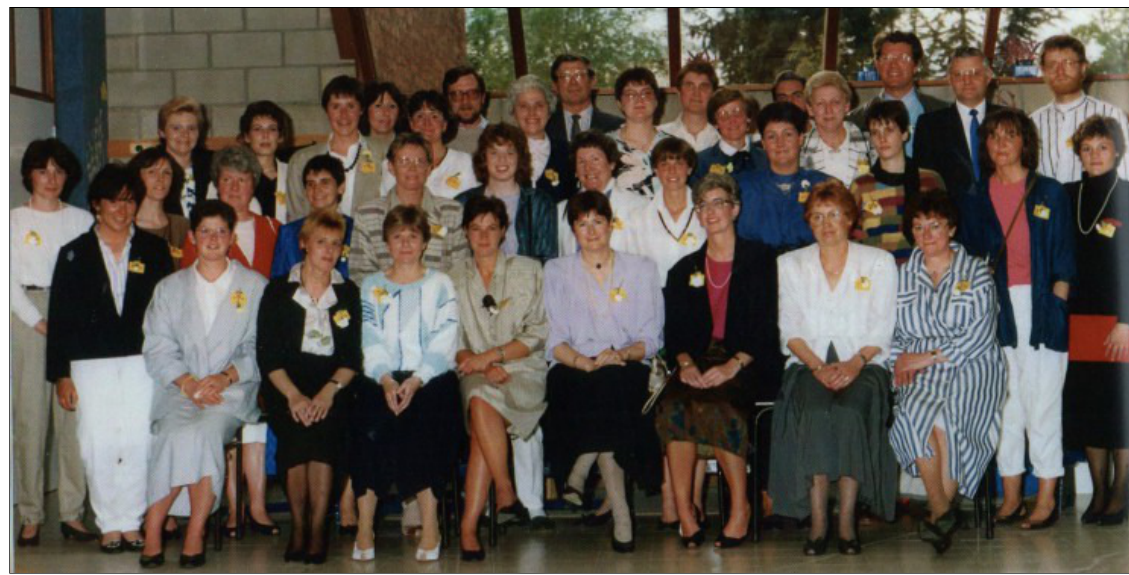
Personeel in dienst in 1987

( https://www.youtube.com/watch?v=08wACbja6cg )