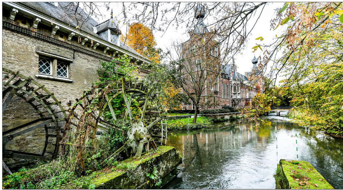
Iconische watermolen aan het Arenbergkasteel

Iconische watermolen aan het Arenbergkasteel in Heverlee in ere hersteld - KU Leuven