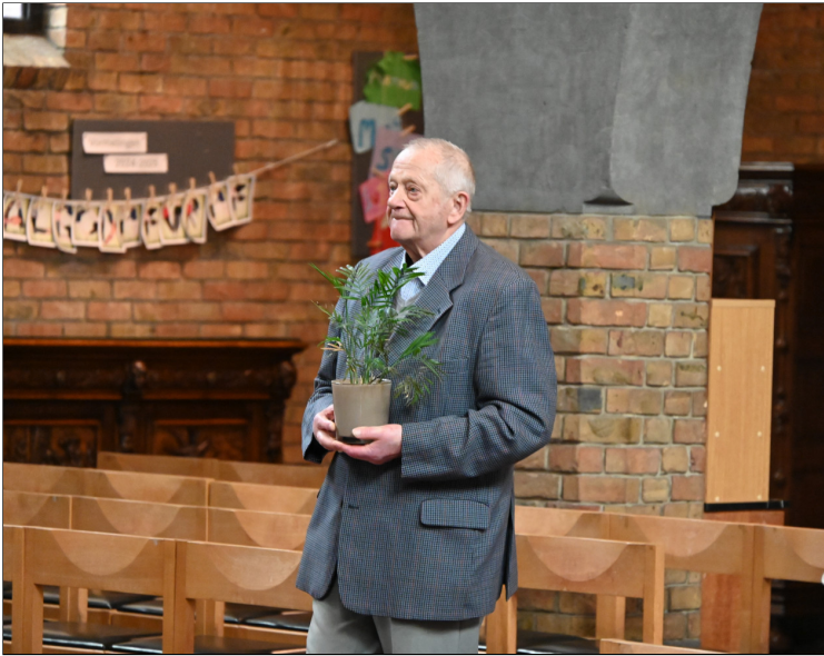
...dank voor de 80 ste verjaardag van 2 mensen die elkaar graag zien

Met Broederlijk Delen willen we samen succes oogsten. We slaan de hand aan de ploeg en zaaien hoop op een betere en gezondere wereld waar elke mens toekomst vindt. Vandaag plaatsen we een groen blad, groen teken van leven, voedsel voor allen. Groen de kleur van de schepping, het nieuwe leven op weg naar Pasen. De genade