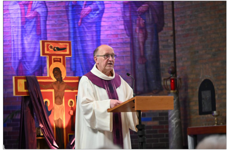
Beste mensen, mag ik jullie vandaag eens een vraag stellen?

Vandaag worden wij in het evangelie geconfronteerd met de gelijkenis van de vijgenboom. En met dat verhaal trekken we onze laarzen aan en trekken richting boomgaard. Er wordt beslist om die onvruchtbare vijgenboom niet om te hakken, maar de boom nog een kans te geven. De tuinman beslist om de grond nog eens goed te bewerken en te bemesten, in de hoop dat hij in