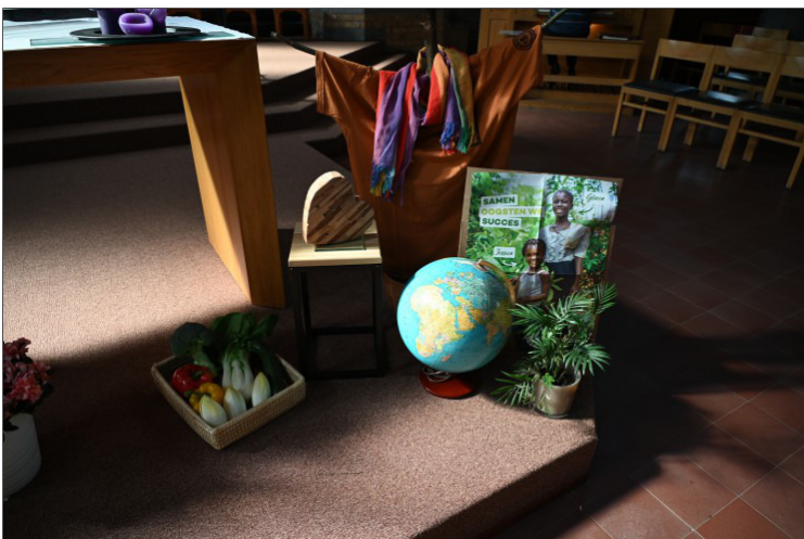
Met Broederlijk Delen willen we samen succes oogsten