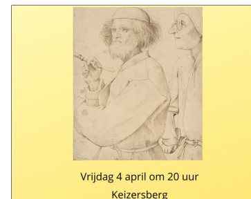
Vrijdag 4 april om 20 uur Keizersberg

BKR BE32 7390 1112 6002 met vermelding 'Lezing Kotsch'