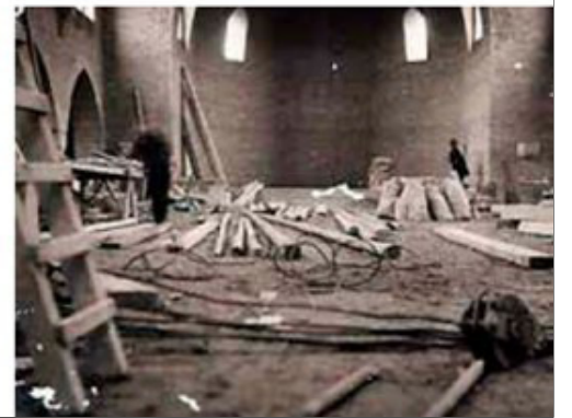
De kerk in opbouw.