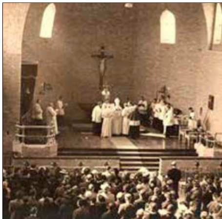
Inzegening kerk door kard. Van Roey 1938. De engelen-fresco's zijn dan nog niet geschilderd.