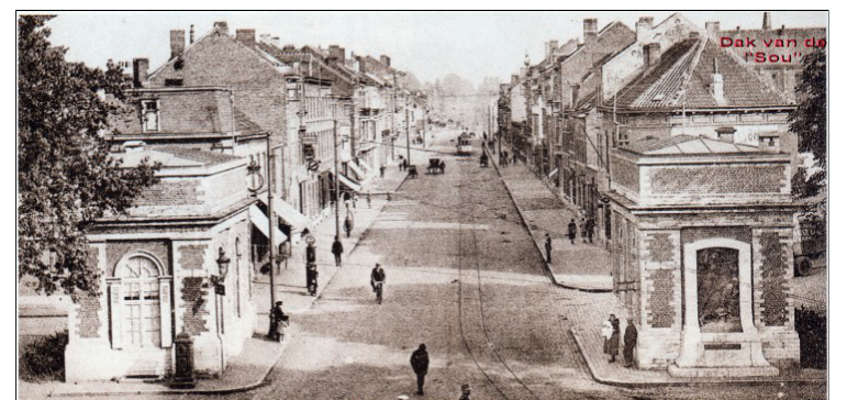
Tiensesteenweg vanuit Tiensepoort rond 1925. Rechtsboven het kloosterdak van de "Sou". In de verte de stadstram "3C.Tiv" van Leuven centrum naar Tivoli.

Uit "Een huis vol mensen" - Boek nog verkrijgbaar.