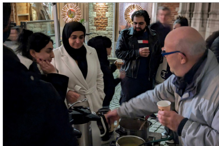
Uitdelen drankjes

PS Een volgende editie van 'Light a candle' in de Sint-Pieterskerk vindt plaats op donderdagavond 10 april 2025.