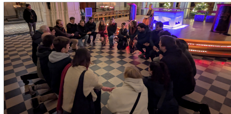
De scouts in een kring

Wie had gedacht dat zoveel studenten van allerlei pluimage zouden binnenstappen? Een reactie als "Nu studeer ik al vier jaar in Leuven, dit is de eerste maal dat ik deze kerk binnenkom," was niet eenmalig. Ze zijn als het ware betoverd door het gebouw en de sfeer. De halfduistere kerk, de stilte, rijen vlammen-de kaarsjes rond het grote Maria-beeld... Gelovig of niet, het imponeert. Sommige studenten vallen in kleine groepjes binnen. Ze hebben van hun bezoek aan de Kerstmarkt een 'kotavond' gemaakt. Dit kerkbezoek maakte er onverwachts deel van uit. Ze krijgen de suggestie mee