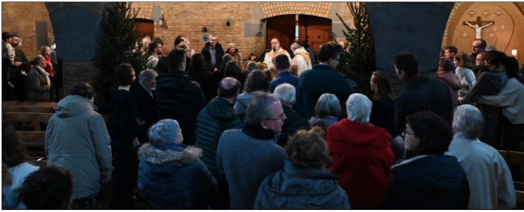
Aan de ingang werd het kerstverhaal ingezet.