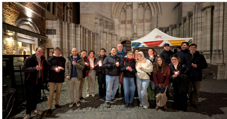
De onthaalploeg

Heel de omgeving van het stadhuis baadde in Kerstlicht. Een plaatje voor vele toeristen en bezoekers van de Kerstmarkt die ook even naar het stadhuis afzakten. De mensen stonden in rijen te wachten om zich te vergapen aan artistieke lichtinstallaties. Maar toch gaat er niets boven het aansteken van een eenvoudig kaarsje. Dat ondervonden we bij onze jaarlijkse 'Light a candle' in de Sint-Pieterskerk. We schrijven woensdag 17 december 2024.