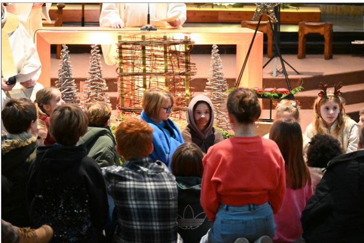
Maria en Jozef, voor de gelegenheid uitgebeeld door twee kinderen, werden omringd door vele kleine herders.