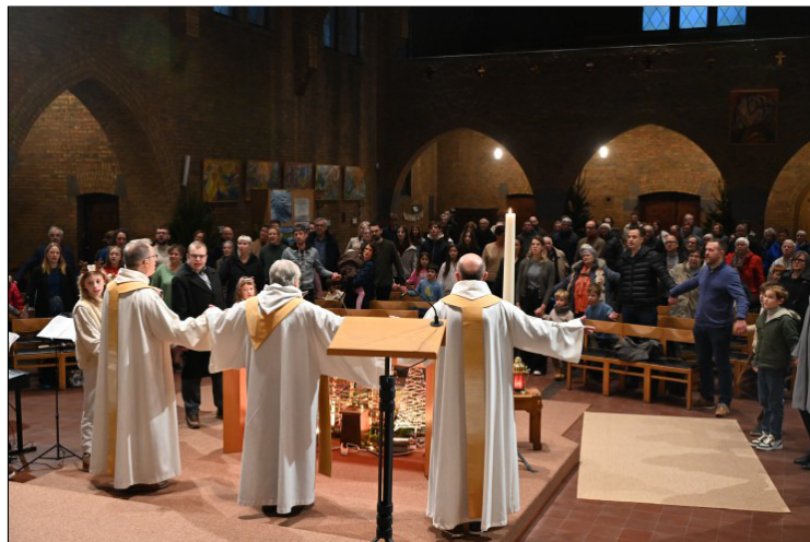
Onze Vader...

Graag neem ik u even mee voor een impressie van de vieringen van Kerstmis in de Sint-Franciscusparochie.