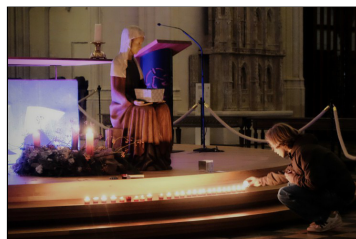
Jongen steekt kaars aan

Ik heb dichterbij de deur post gevat. Op een stoel affiches van Kamino, de organisatie die vroeger IJD Jongerenpastoraal Vlaanderen heette. Op deze posters vlammen de kaarsjes verder in hoopvolle adventsgedachten, vertolkt door jonge mensen. Hebben mensen niet nood aan hoop op kille duistere dagen en avonden? Ik bied de posters als presentje aan jonge mensen. Het biedt mij de kans om een gesprek