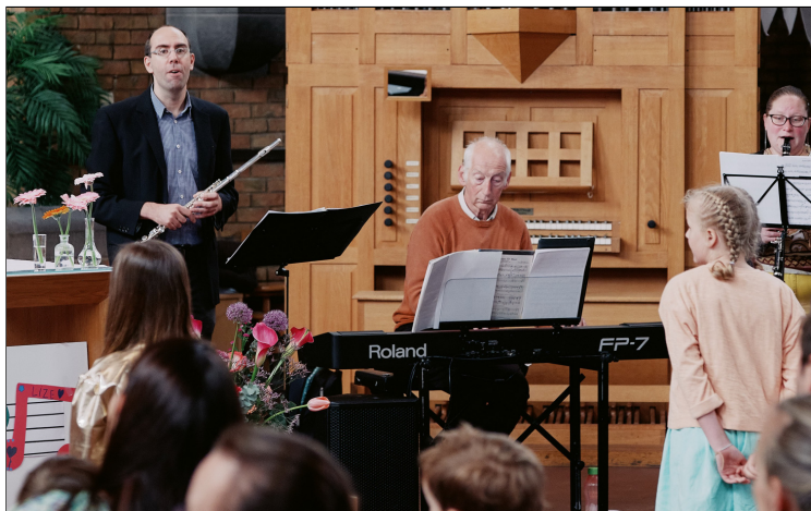
Familieviering Eerste communie - donderdag 9 mei 2024 O.H.Hemelvaart