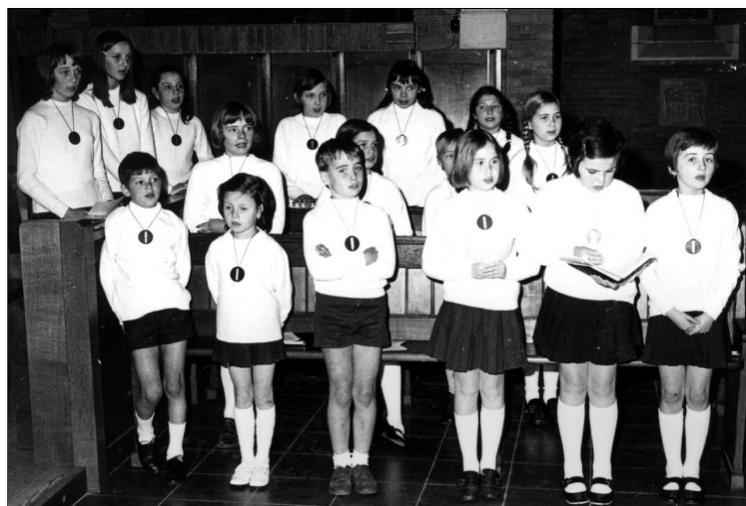
Een foto uit de beginperiode

De thuisbasis van De Orgelpijpjes is nog steeds de parochie Onze-Lieve-Vrouw van Troost, waar ze in 1960 opgericht werden als knapenkoor 'De Orgelpijpjes'.