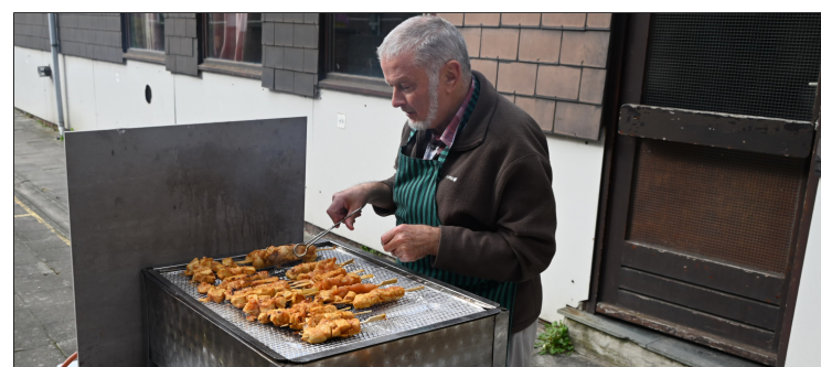
...de hoeveelste BBQ zou dit zijn?