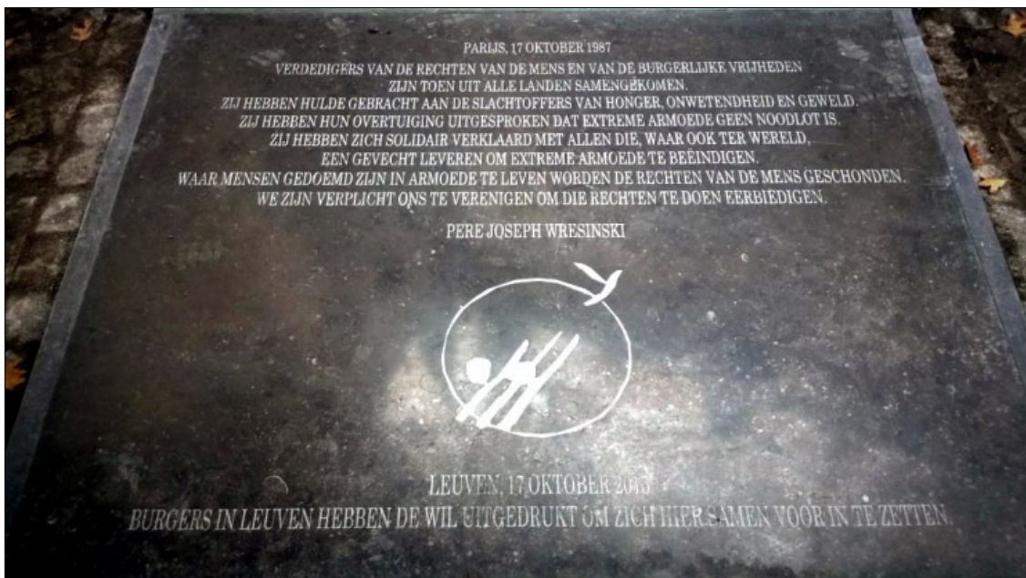
Om 14 u start op het Martelarenplein een stille optocht richting Grote Markt, waar we om 14.45 uur een herdenkingsmoment hebben aan de Steen tegen Armoede.

“Kansarmoede” verwijst ook heel uitdrukkelijk naar uitsluiting, naar een gebrek aan kansen om een volwaardig en menswaardig bestaan uit te bouwen. Het gaat vaak over een samenloop van omstandigheden: geen geschikte of aangepaste woning, een tekort aan middelen om te kunnen voldoen aan