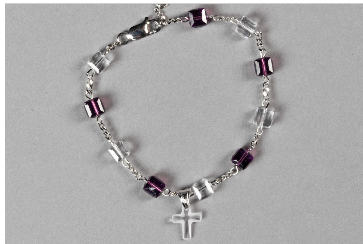
Tientje Swarovski