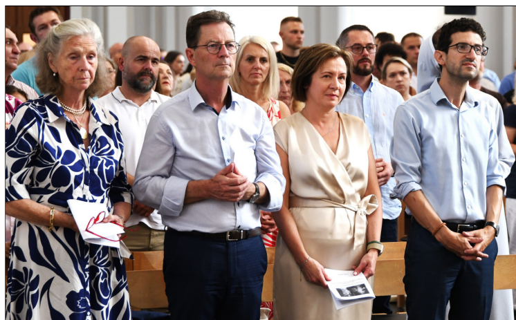
Vertegenwoordigers stadsbestuur en ambassade